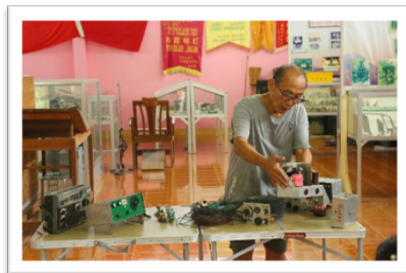
ภาพที่ 3 กิจกรรมย้อนรอยฐานพรรคคอมมิวนิสต์มาลาया