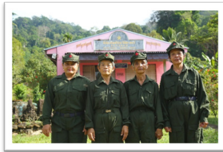
ภาพที่ 2 กิจกรรมต้อนรับนักท่องเที่ยว