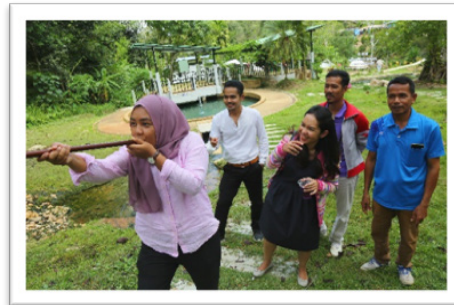
ภาพที่ 6 กิจกรรมเรียนรู้อุปกรณ์การดำรงชีวิตของกลุ่มชาติพันธุ์