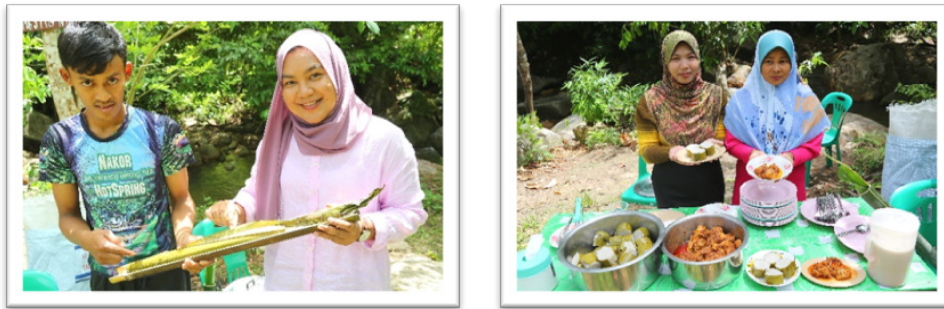
ภาพที่ 8 กิจกรรมลงมือทำข้าวหลามบาซูก้า