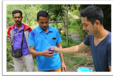
ภาพที่ 5 กิจกรรมต้อนรับนักท่องเที่ยว (Welcome Drink)