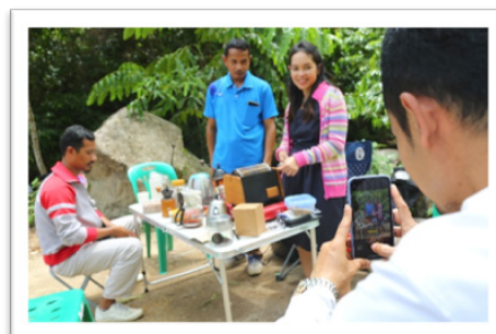
ภาพที่ 7 กิจกรรมเปิดประสบการณ์สัมผัสกาแฟสด