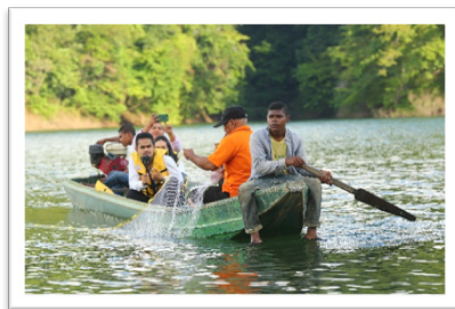
ภาพที่ 4 กิจกรรมเรียนรู้วิถีประมงพื้นบ้าน