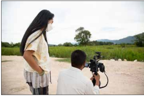
ภาพที่ 2 ผู้กำกับตรวจเช็คมุมกล้องขณะถ่ายทำหนังสือ เมื่อวันที่ 17 กุมภาพันธ์ 2566