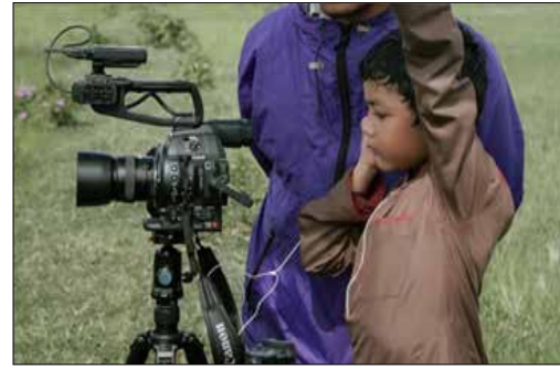
ภาพที่ 3 นักแสดงเด็กเช็คเสียงสนทนาของตนเอง ระหว่างการถ่ายทำภาพยนตร์สั้น ที่มา : ภาพถ่ายโดยผู้สร้างสรรค์ เมื่อวันที่ 17 กุมภาพันธ์ 2566

จากการลำดับฉากภาพยนตร์สั้น เรื่อง สายป่าน-สายสัมพันธ์ เป็นการเรียบเรียงเนื้อหา ที่แสดง