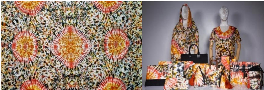
ภาพที่ 1 ลวดลายผ้าชะเลียงร้อนทอง และผลิตภัณฑ์ของที่ระลึกจากลวดลายผ้าชะเลียงร้อน