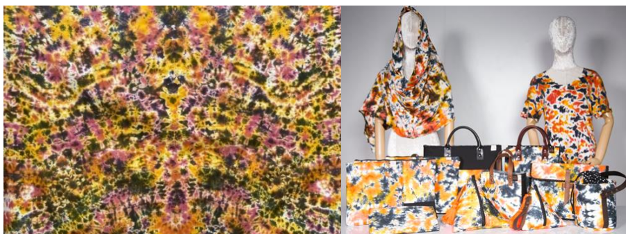
ภาพที่ 3 ลวดลายผ้ามัดย้อมเพชรพระอูมา และผลิตภัณฑ์ของที่ระลึกจากลวดลายผ้ามัดย้อมเพชรพระอูมา