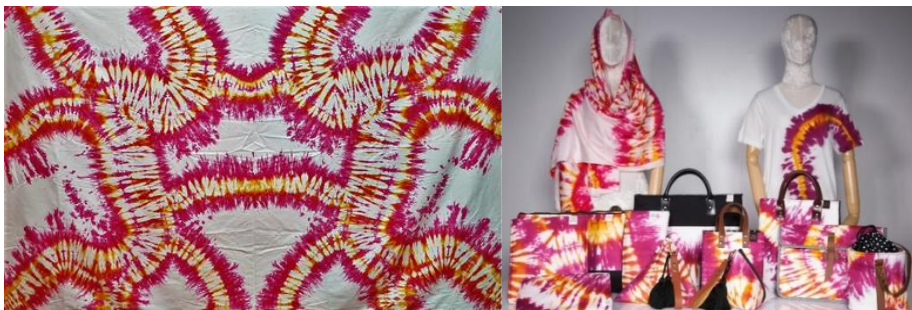
ภาพที่ 2 ลวดลายผ้ามัดย้อมนางครวญหน้าถ้ำ และผลิตภัณฑ์ของที่ระลึกจากลวดลายผ้ามัดย้อมนางครวญหน้าถ้ำ