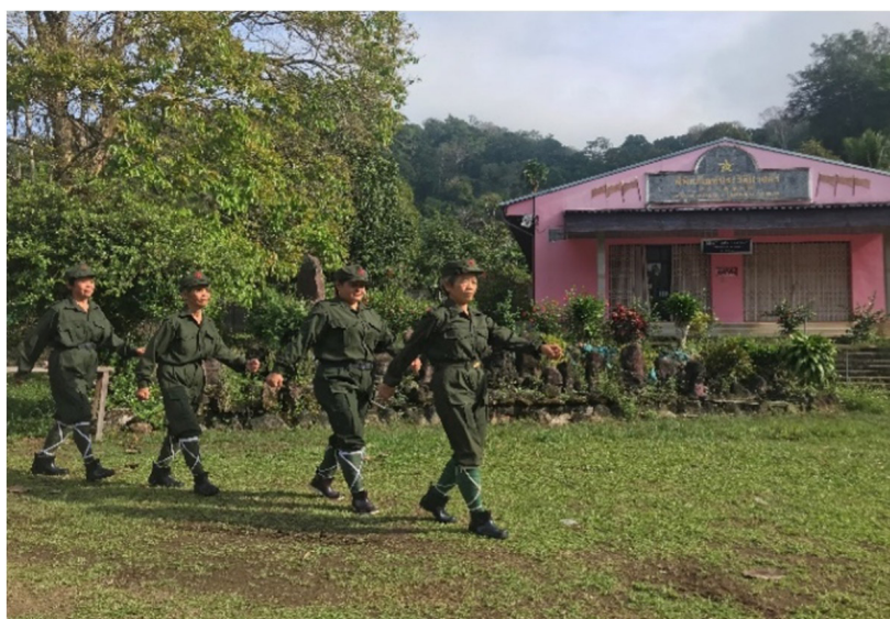
พิพิธภัณฑสถานประวัติศาสตร์ของพรรคคอมมิวนิสต์มาลายา