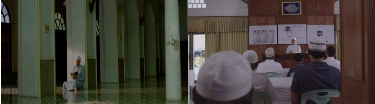
ภาพที่ 6 ภาพสะท้อนสังคมด้านวัฒนธรรมการเรียนรู้ศาสนา

“การอ่านคำภีร์อัลกุรอานและการฟังบรรยายธรรมเป็นหนึ่งในกระบวนการเรียนรู้ศาสนาอิสลาม”