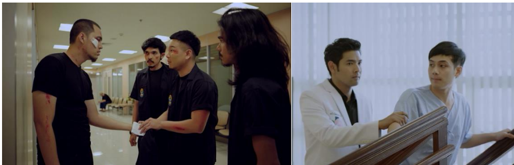
ภาพที่ 15 ภาพสะท้อนสังคมด้านวัฒนธรรมการเชื่อในบทธงโทษจากพระเจ้า

เมื่อพิจารณาจึงเห็นว่าภาพยนตร์ ฯ สะท้อนความเอื้อเฟื้อเผื่อแผ่ 2 มิติ กล่าวคือ มิติแรกคือน้ำใจของมุสลิมที่มีต่อมุสลิมด้วยกัน เช่น หมอบริจาคเงินรักษาชันมาน และ มิติที่สองคือน้ำใจของเพื่อนต่างศาสนาที่มีต่อมุสลิม เช่น เพื่อนร่วมสถาบันบริจาคเงินให้สามีไว้เป็นค่ารักษาพยาบาลของชันมานภาพสะท้อนข้างต้นแสดงถึงสถานะทางศาสนาที่แตกต่างกันไม่ได้เป็นข้อจำกัดต่อการสร้างมิตรภาพระหว่างเพื่อนมนุษย์