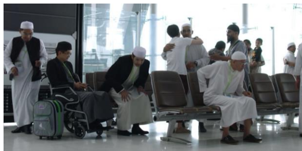
ภาพที่ 12 ภาพสะท้อนสังคมด้านวัฒนธรรมการเดินทางไปประกอบพิธีฮัจญ์

ลาลา: “อัลลอฮฺกำหนดให้คุณเดินทางไปต่างหาก คุณรู้ไหมผมทำฮัจญ์ติดต่อกันมาเป็นสิบ ๆ ปี ผมเคยคิดว่าการทำฮัจญ์ของผมยิ่งใหญ่ที่สุด แต่วันนี้ผมละอายต่อคุณมาก ผมว่าการทำฮัจญ์ของคุณแค่ครั้งเดียวดีกว่าพันฮัจญ์ของผมเสียอีก”