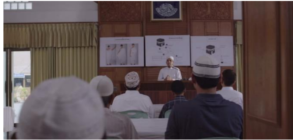
ภาพที่ 3 ภาพสะท้อนสังคมด้านวัฒนธรรมการดำรงสถานภาพผู้นำทางศาสนา

อีหม่าม: “ผลบุญอันยิ่งใหญ่ของการทำฮัจญ์ที่ถูกตอบรับนั้นคือสวนสวรรค์และการที่เราจะได้กลับมาเยี่ยมบ้านเกิดเมืองนอนของเราโดยสภาพเสมือนเด็กที่เพิ่งเกิดออกมาจากครรภ์ของมารดา ไม่มีความผิดใดติดตัว”