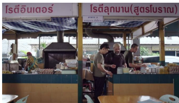
ภาพที่ 1 ภาพสะท้อนสังคมด้านวัฒนธรรมการประกอบอาชีพขายโรตีส

ชาห์มี: “ผมมีเรียนปายอะปา เตี้ยวอยู่ช่วยปายาโรตีก่อนก็ได้”