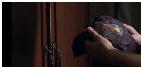
ภาพที่ 7 ภาพสะท้อนสังคมด้านวัฒนธรรมระดับจิตใจ

1.2.3 การระบายความทุกข์ในจิตใจ เป็นภาพสะท้อนการดับทุกข์ด้วยการขอพรต่อพระเจ้าของชาวมุสลิม โดยภาพยนตร์ฯ นำเสนอการระบายความทุกข์ในจิตใจของตัวละคร คิดเป็นร้อยละ 7.5