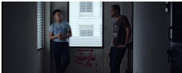
ภาพที่ 14 ภาพสะท้อนสังคมด้านวัฒนธรรมการเชื่อในบทลงโทษจากพระเจ้า

ซามีย์: “มึงคิดดูนะ คนที่ยอมตักงานเพราะไม่ยอมทิ้งละหมาดจะยอมทำบาปเพื่อแลกกับเงินเหอวะ”