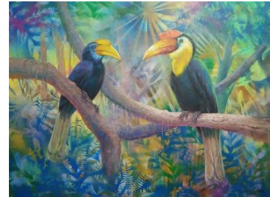
ผลงานชิ้นที่ 3 นกเงือกปากย่น