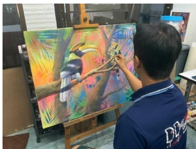
ลำดับที่ 8 เก็บรายละเอียดภาพโดยรวม