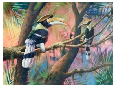
ลำดับที่ 9 ภาพที่เสร็จสมบูรณ์