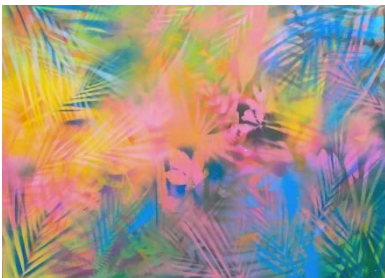
ลำดับที่ 4 ภาพที่ผ่านการพ่น