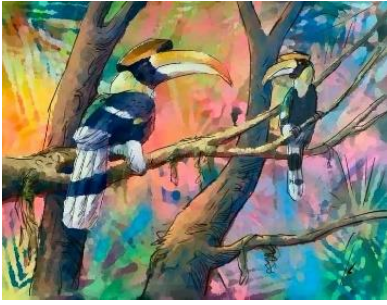
ลำดับที่ 1 ภาพร่าง