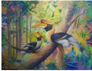
ผลงานชิ้นที่ 2 นกกาฮัง 2