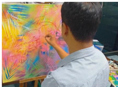
ลำดับที่ 5 การร่างรูป