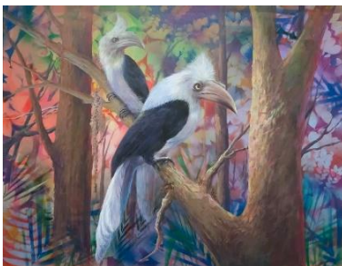
ผลงานชิ้นที่ 4 นกเงือกหัวหงอก