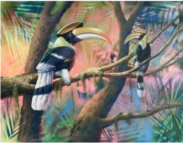
ผลงานชิ้นที่ 1 นกกาฮัง 1