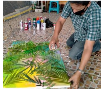
ลำดับที่ 3 การพ่นสีสเปรย์