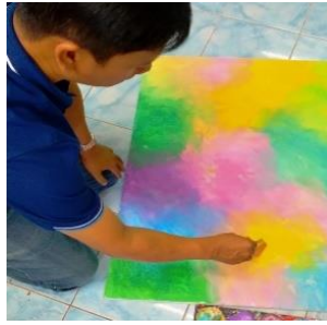
ลำดับที่ 2 การระบายสีพื้น