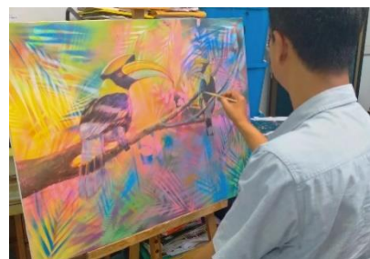
ลำดับที่ 6 เริ่มลงสีชั้นที่ 1