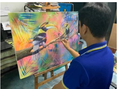
ลำดับที่ 7 ภาพลงสีชั้นที่ 2