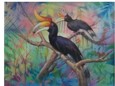
ผลงานชิ้นที่ 6 นกเงือกหัวแรด