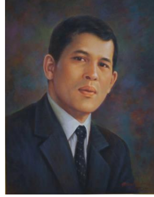
ภาพที่ 1 รัชกาลที่ 10 แห่งราชวงศ์จักรี