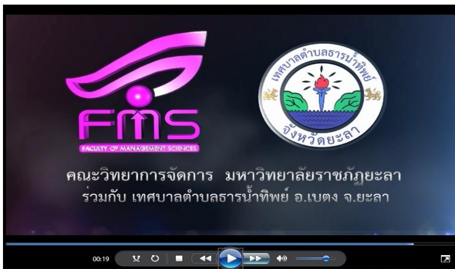
ภาพที่ 3 คลิปวิดีโอ เกี่ยวกับกิจกรรมการท่องเที่ยวของชุมชนธารน้ำทิพย์