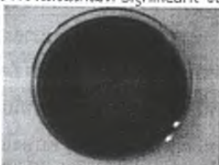
ภาพที่ 2 การสร้างวงใสในเกณฑ์ Moderate ของไอโซเลต DO2