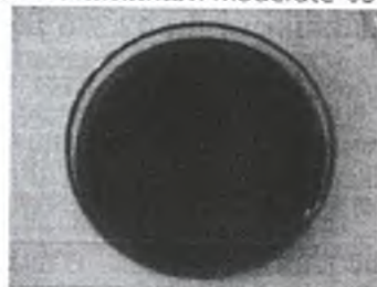
ภาพที่ 3 การสร้างวงใสในเกณฑ์ Negligible ของไอโซเลต AO2