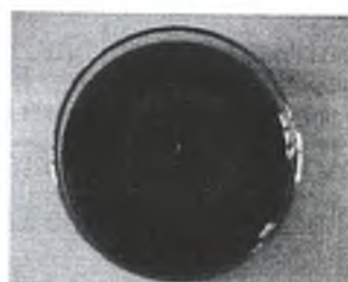
ภาพที่ 1 การสร้างวงใสในเกณฑ์ Significant ของไอโซเลต AO1

เมื่อเปรียบเทียบความสามารถผลิตเอนไซม์ทั้งสองชนิดของเชื้อราที่แยกได้ พบว่า เชื้อราที่รื้อดั่งกล่าวสามารถผลิตเอนไซม์เซลลูลาเนสได้ก่อนและมีปริมาณกิจกรรมสูงกว่าเอนไซม์ เซลลูเลส เนื่องจากเอมิเซลลูเลสเป็นสารที่ย่อยได้ง่ายกว่าเซลลูเลส (Chahal, 1986 อ้างโดย จารุวรรณ มณีศรี, 2538) และไซแลนซึ่งเป็นองค์ประกอบหลักของเอมิเซลลูเลสจะขัดขวางการผลิตของเอนไซม์เซลลูเลส (Gamerith, et al, 1992 อ้างโดยจารุวรรณ มณีศรี, 2538)