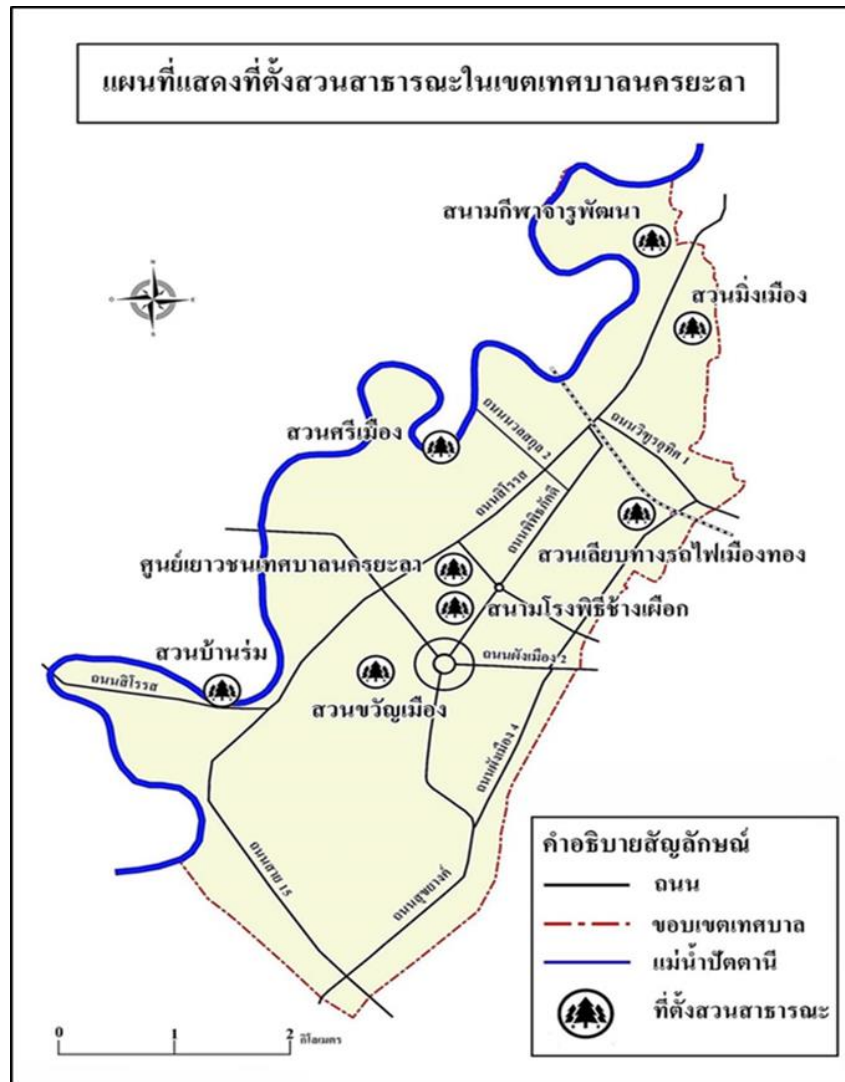
ภาพที่ 2 แผนที่แสดงที่ตั้งสวนสาธารณะในเขตเทศบาลนครยะลา