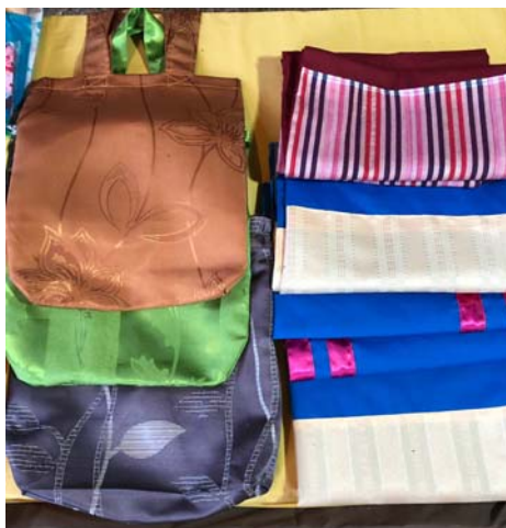
( การทดลองตลาดที่ตลาดท่าแพ มกราคม – มิถุนายน 2562)