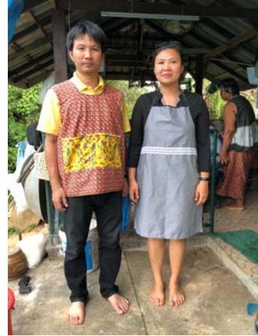
ผ้ากันเปื้อน