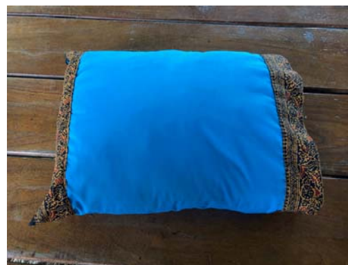
ปลอกหมอนลายพื้นเมืองภาคใต้