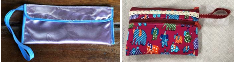
กระเป๋าถือผู้หญิงขนาดเล็ก