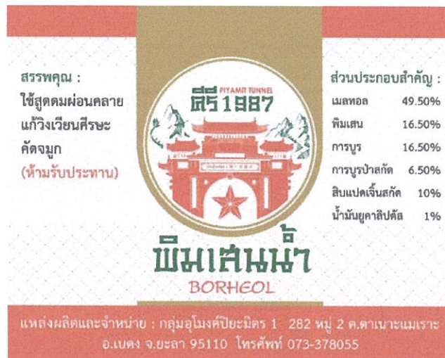
ภาพฉลากผลิตภัณฑ์พิมเสนน้ำ “คีรี1987”