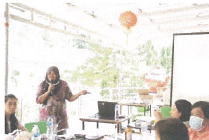
ภาพการอบรมด้านการวิเคราะห์ต้นทุนและการกำหนดราคา