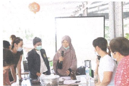
ภาพการอบรมด้านการผลิต