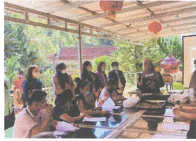
ภาพคนบดคณบดีคณะวิทยาการจัดการกล่าวเปิดการอบรม และการอบรมด้านการตลาด