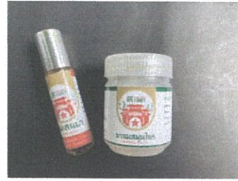
ภาพโลโก้ และฉลากผลิตภัณฑ์พิมเสนน้ำและยาตมสมุนไพร “คีรี1987”