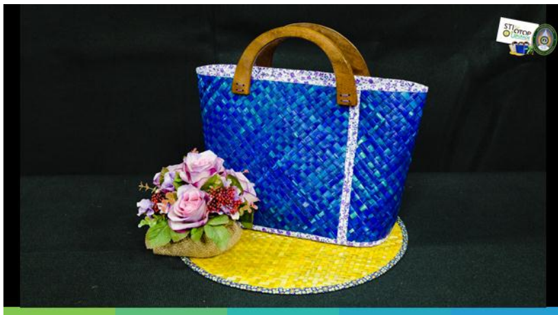
กระเป๋ารูปแบบที่ 1