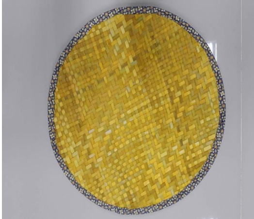
แผ่นวางสำหรับอาหารขนาดทรงกลม