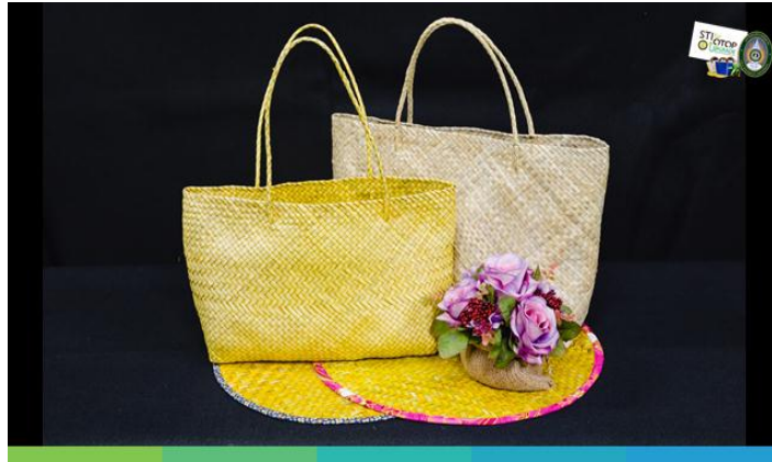
กระเป๋าแบบที่ 2 และ 3