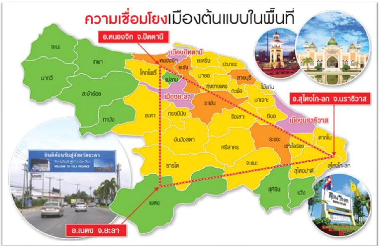
ภาพที่ 1.1: แผนที่ความเชื่อมโยงเมืองต้นแบบ“สามเหลี่ยมมั่นคง มั่งคั่ง ยั่งยืน”

อ.เบตง จังหวัดยะลา มีพื้นที่อยู่ทางตอนใต้สุดของประเทศไทย สภาพภูมิประเทศส่วนใหญ่โอบล้อมด้วยภูเขาสูงส่งผลให้มีอากาศหนาวเย็นตลอดปี ด้วยความโดดเด่นทางภูมิศาสตร์เฉพาะตัวตรงนี้ ทำให้เบตงกลายเป็นเมืองท่องเที่ยวที่มีเสน่ห์และน่าสนใจ เบตงมีแหล่งท่องเที่ยวมากมายที่สวยงามและโดดเด่นเป็นเอกลักษณ์อาทิ มีตู้ไปรษณีย์ที่ใหญ่ที่สุดในโลก มีอุโมงค์รถยนต์รอบภูเขาแห่งแรกของประเทศไทย สนามกีฬาที่สูงที่สุดในประเทศไทย มีโรงเรียนสอนภาษาจีนแห่งแรกที่ใหญ่ที่สุดในเบตง มีพระพุทธรูปทองคำสัมฤทธิ์องค์ใหญ่ที่สุดในประเทศไทย รวมทั้งสวนดอกไม้เมืองหนาวแห่งเดียวในภาคใต้ก็อยู่ที่เบตง นอกจากนี้ทรัพยากรการท่องเที่ยวที่กล่าวมาแล้ว ในส่วนของวิถีชีวิตวัฒนธรรมประเพณีและอาหารการกินในเบตงก็มีความโดดเด่น เรียบง่ายและมีความหลากหลายอันเนื่องมาจากการอยู่ร่วมกันของกลุ่มคนหลากหลายเชื้อชาติ ศาสนาซึ่งต่างมีวัฒนธรรมที่มีเอกลักษณ์เฉพาะตัว ทำให้เกิดการผสมผสานทางวัฒนธรรมและวิถีชีวิตกันอย่างลงตัวส่งผลให้เบตงกลายเป็นเมืองพหุวัฒนธรรมที่มีความหลากหลายทางวัฒนธรรมมากที่สุดของประเทศ และเบตงยังเป็นเมืองท่องเที่ยวทางภาคใต้ตอนล่างที่สร้างรายได้เข้าประเทศมากที่สุดอีกด้วย (Chaiporn Suphahitanukool, 2559, อ้างถึงใน กัญฐิมา แก้วงาม และ วิไลวรรณ วงวิไลเกษม, 2562, หน้า 42)