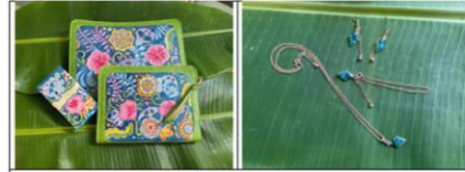
อัตลักษณ์ “ป่าฮาลาบลากา”

องค์ความรู้ “เราใจ เราถึง พมณา : อัตลักษณ์ผลิตภัณฑ์ชุมชน”