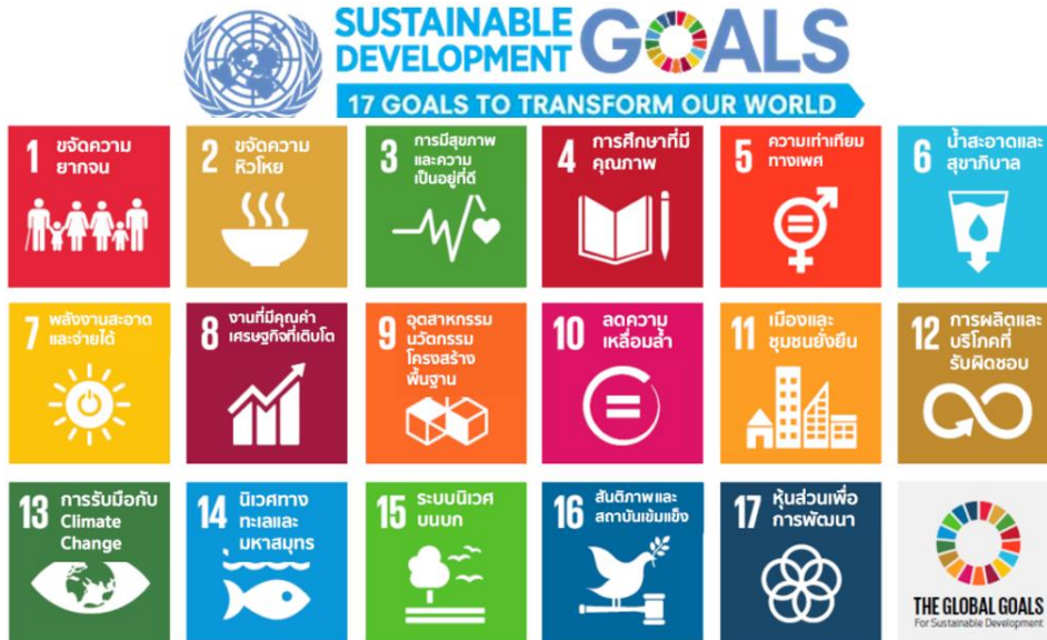
ภาพที่ 2 เป้าหมายเพื่อการพัฒนาที่ยั่งยืนขององค์การสหประชาชาติ

2. ทดลองนำแนวคิดประยุกต์ใช้กับตัวเองด้านงานวิจัย ซึ่งพบว่า สิ่งที่รัก และสิ่งที่ทำได้ดี สามารถนำมารวมควบคู่กัน หากแต่โจทย์ความต้องการของสถาบันหรือหน่วยงานที่สนับสนุนทุนวิจัย จัดเป็นตัวแปรสำคัญในการยื่นทุนวิจัยเพื่อขอรับการสนับสนุนงบประมาณวิจัย