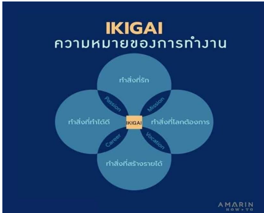
ภาพที่ 1 แนวคิด Ikigai

จิตวิญญาณ ผ่านการแสวงหาและค้นพบตัวตนที่เหมาะสมลงตัว ภายใต้จุดร่วมหลักการ 4 ข้อของอิคิไก โดยการค้นหาคำตอบถึง สิ่งที่เรา (love) สิ่งที่เราทำได้ดี (good at) สิ่งที่ทำให้เกิดรายได้ (paid for) และสิ่งที่สังคมต้องการ (world needs) ซึ่งจะส่งผลต่อชีวิตการทำงานที่มีความหมาย มีความสุข และมีความยั่งยืน ดังภาพที่ 1