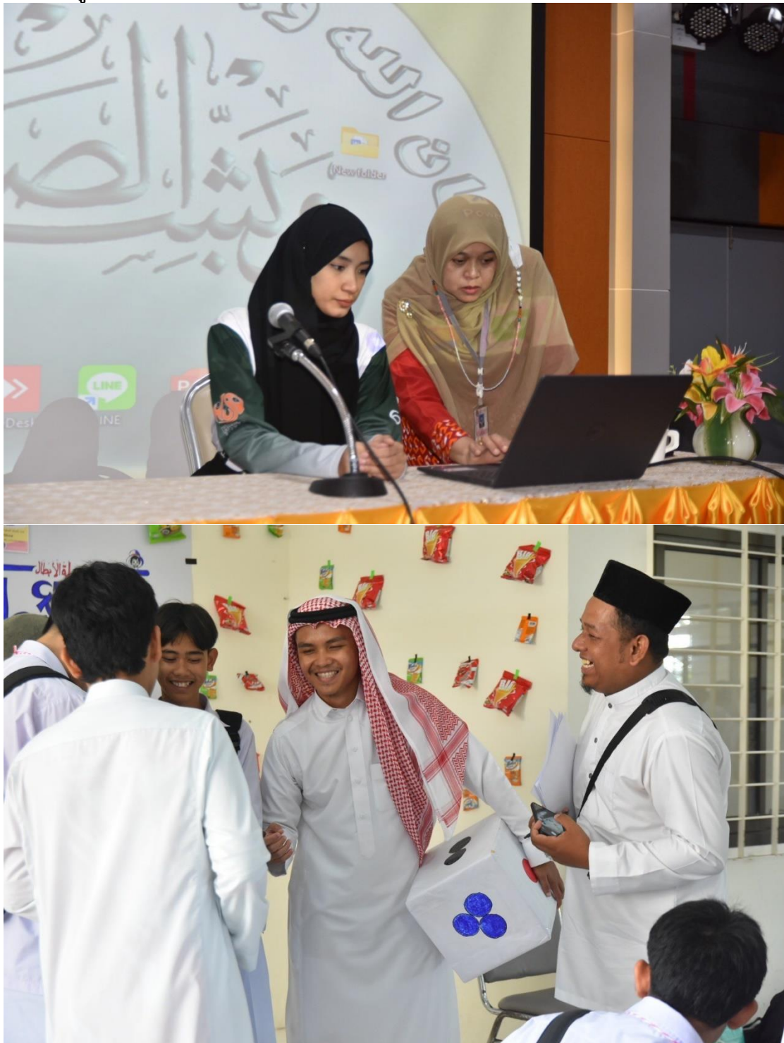
ภาพรวมผู้เข้าร่วมกิจกรรม