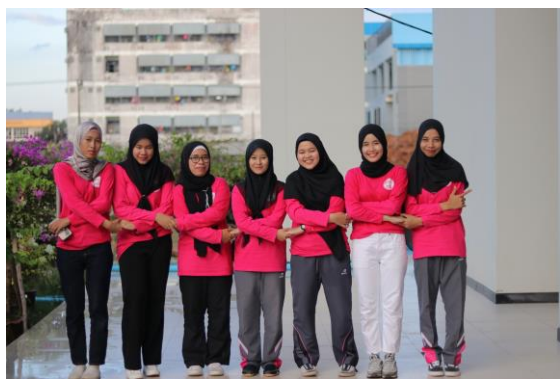
ภาพนักศึกษา