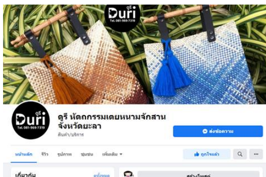
ภาพช่องทางการตลาดออฟไลน์และออนไลน์