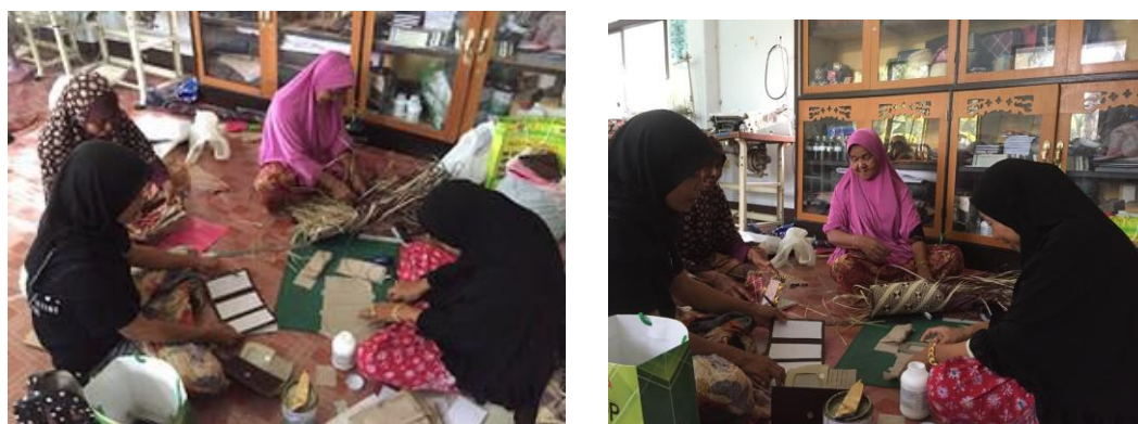
ภาพหมู่คณะกรรมการ/สมาชิกของกลุ่ม