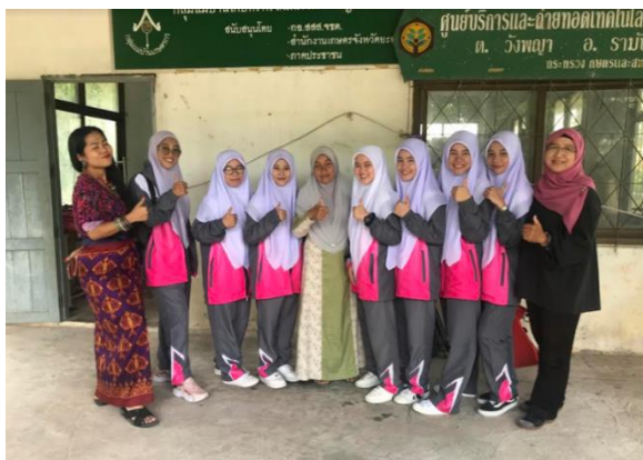
ภาพอาคารสำนักงานกลุ่ม