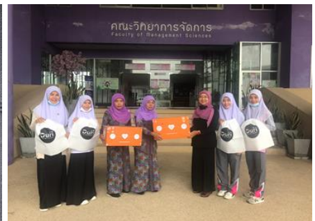
ภาพผลิตภัณฑ์/บริการ (หลัง)