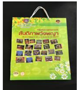
ภาพผลิตภัณฑ์/บริการ (ก่อน)