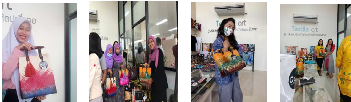
ภาพเมื่อนำสินค้าไปจำหน่ายในสถานที่ต่างๆ