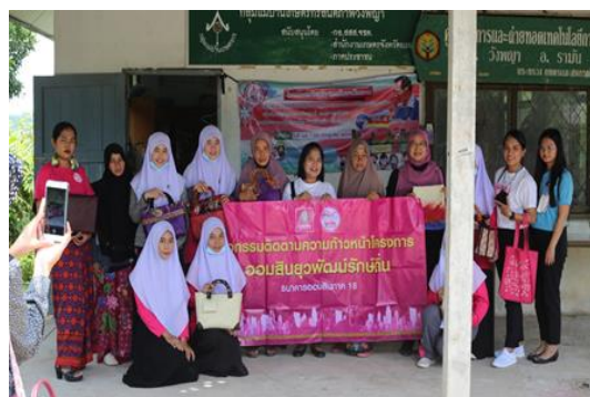
ภาพการทำงานร่วมของธนาคารออมสิน