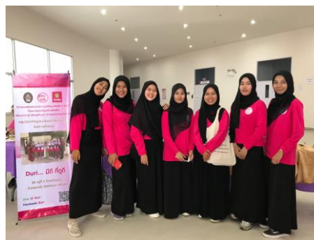
ภาพวันนำเสนอโครงการย่อย