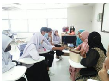
ภาพการสอนจัดทำบัญชีต้นทุนกลุ่ม