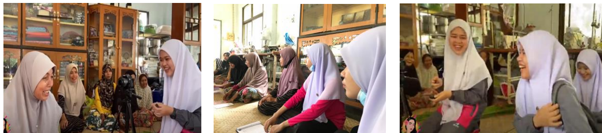
ภาพการประชุมร่วมกับกลุ่มชุมชน ภาพการลงพื้นที่สำรวจความต้องการของนักศึกษาที่กลุ่มชุมชน