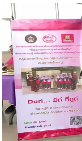
ภาพ X-Stand ผลสัมฤทธิ์ ที่ใช้ในวันปิดโครงการ