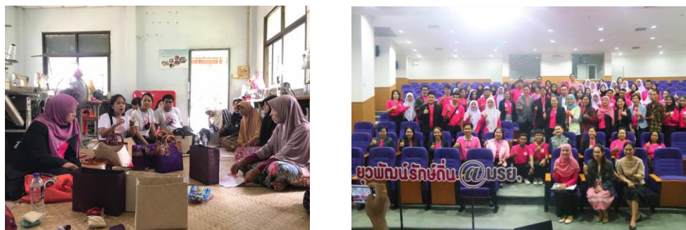
ภาพถ่ายร่วมกับหน่วยงานภาคี

16. PPT ที่นำเสนอวันปิดโครงการ (File ใสใน Flash Drive)