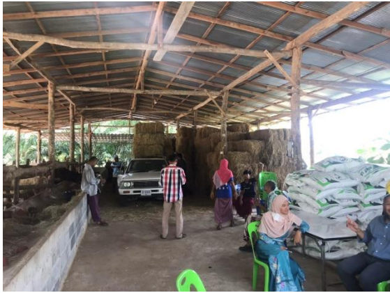
ภาพถ่ายการดำเนินบริการวิชาการ เรื่อง ระบบสารสนเทศเพื่อบริหารจัดการวิสาหกิจชุมชน